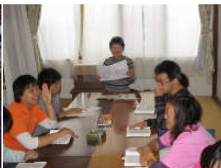
グローイングハート