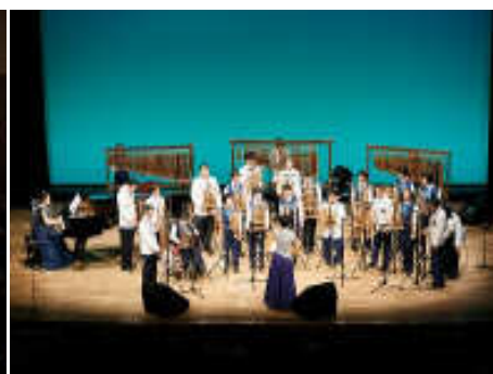
こうべ障害者音楽フェア