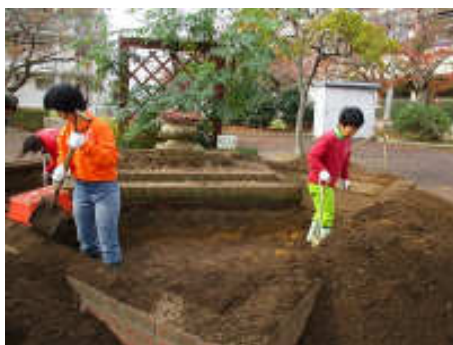
市民花壇「オアシス」