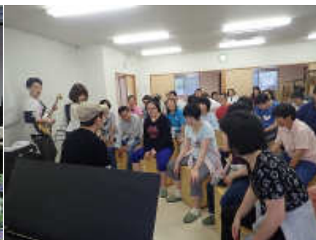
カホーンワークショップ