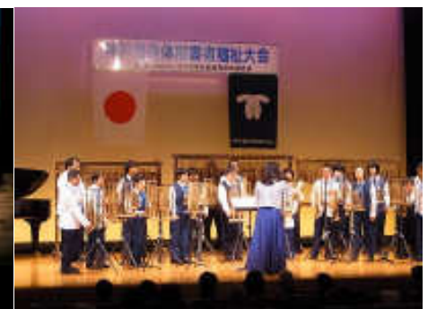
神戸市身体障害者福祉大会