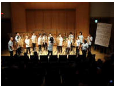
ラアハバ夏の発表会