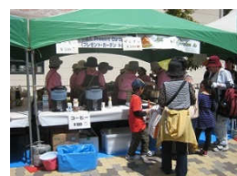
たるみっ子まつり