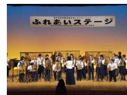
神戸文化ホールにて