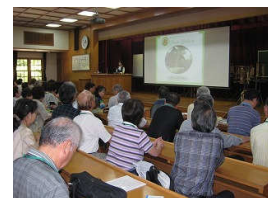
園芸療法実践報告