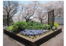
東谷公園市民花壇