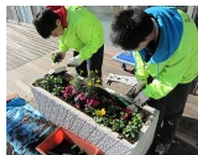
役務 橋の科学館植栽業務