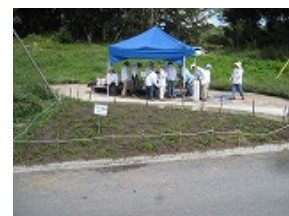
藍那里山活動スマイル増殖