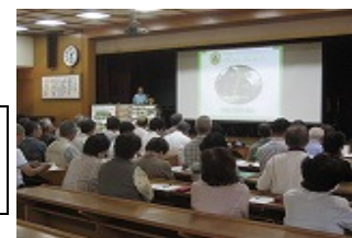
園芸療法実践報告