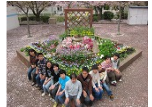
東谷公園市民花壇