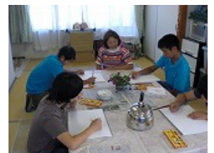
ピクチャータイム