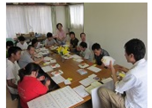
グローイングハート