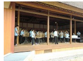
藍那里山公園にて